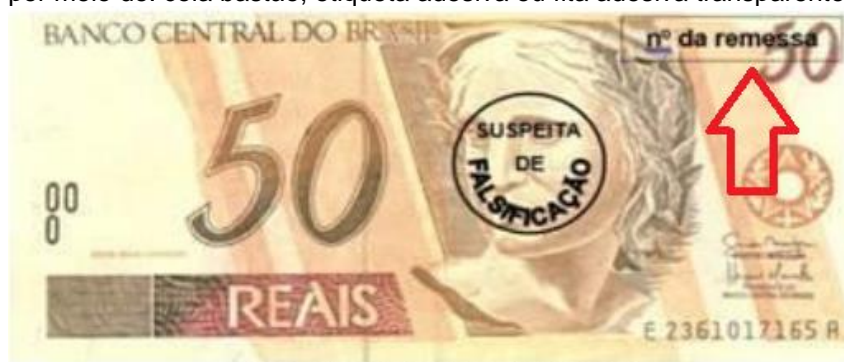
Exemplar de cédula da primeira família do Real