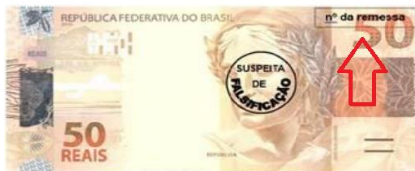
Exemplar de cédula da segunda família do Real